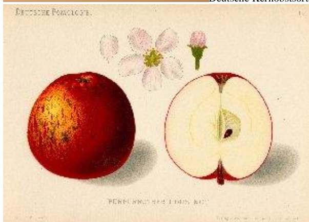
W.Lauche Deutsche Pomologie 1882/83