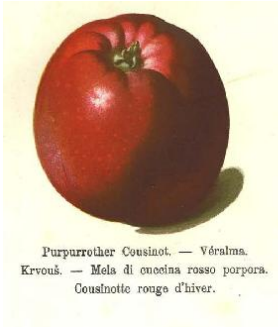
R.Stoll 1888 Pomologie en Autriche.